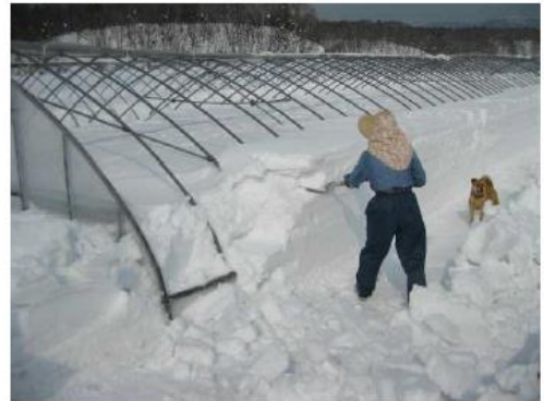
肩部直管パイプを露出させること

(2) ハウスパイプの変形・折損は、融雪時にパイプの周りに密着した雪が下がっていく時の力（沈降圧）で曲がるため、アーチパイプの肩の曲がり部分に雪を載せない事が重要です。