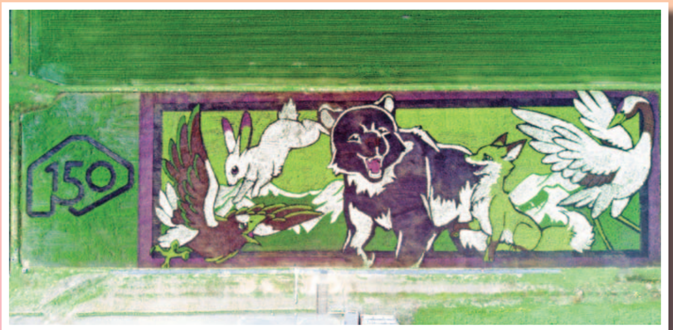
田んぼアート2018 ～北海道命名150年を記念した動物達～