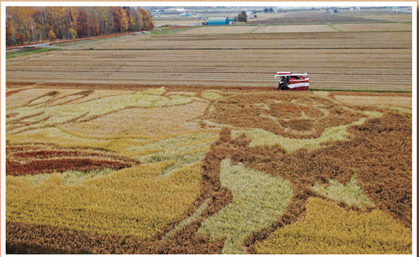
田んぼアートの稲刈作業が行われました