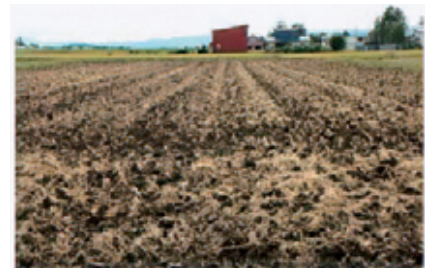
写真2 稲わら鋤込みの例

秋に稲わらを鋤き込むことにより、翌年産の水張前までに稲わらの腐熟を促進させ、水張後のメタンガス（わき）の発生を抑制することができます。新たに「みどりの食料システム戦略」や「SDGs」に即した農業による環境負荷軽減の取り組みとして秋鋤込みが大事になりますので、稲刈り後の鋤込み実施をお願いします。