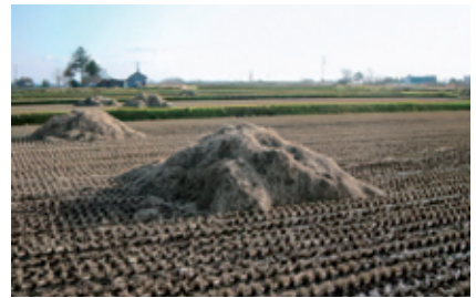
写真1 稲わらの再利用

稲わらの弊害を少しでも軽減するための栽培技術として、秋の鋤込みがあります。鋤込みは出来るだけ早めに行い、耕起深は5cm程度（写真2参照）とし、わらと土の接触を高め稲わらの腐熟を促進します。