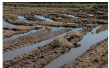
写真3 ほ場を傷めた事例