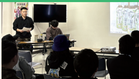
地域応援 女性部・農協理事駆け付け