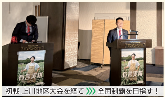
初戦 上川地区大会を経て >>> 全国制覇を目指す！

今回の経験を糧に、JA運動の先頭に立ち、地域の担い手としての責任を胸に、今後も積極的に活動してまいります。引き続き、ご指導ご支援を賜りますようお願い申し上げます。