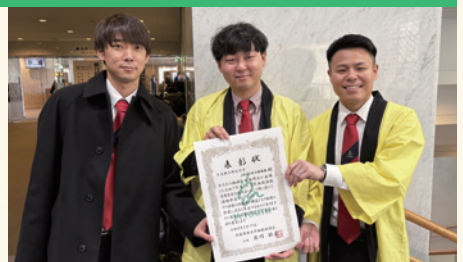
外川青年部長の雪辱果たし全国制覇