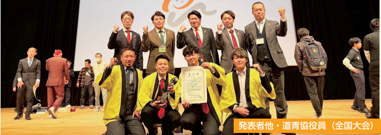
発表者他・道青協役員（全国大会）