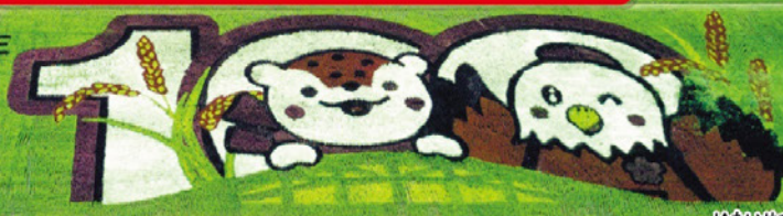
JAたいせつ 田んぼアート2022