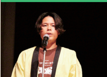
全国田んぼアートサミットでお披露目